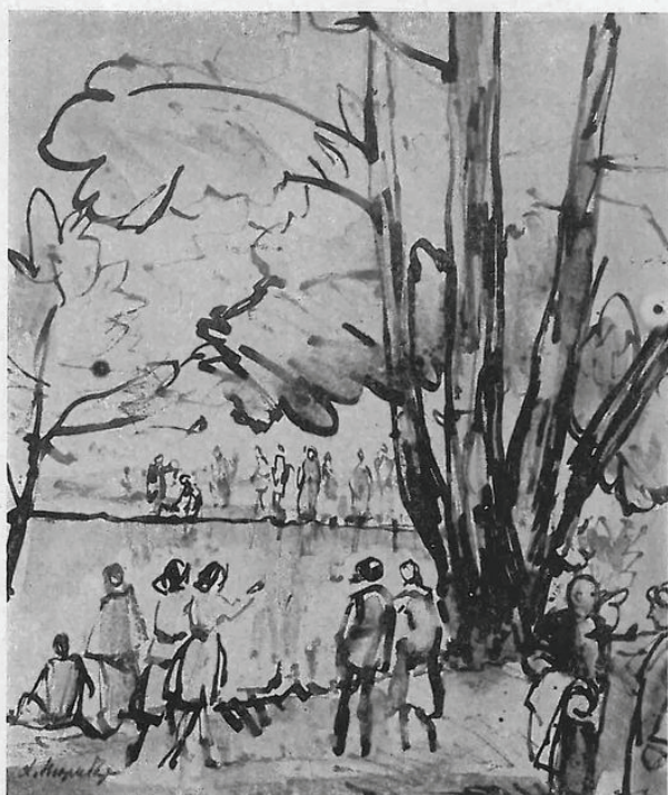
В парке. 1960 г.