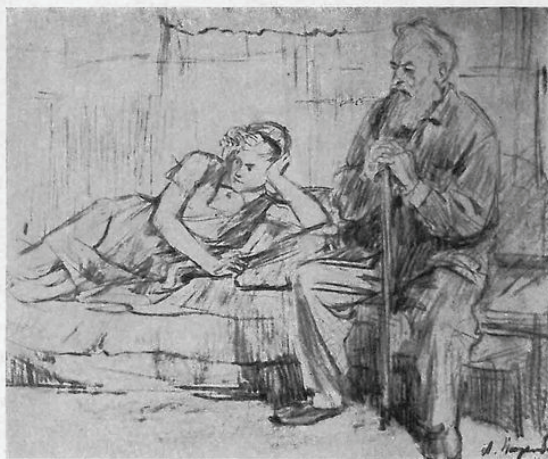
Дедушка и внучка. 1942 г.