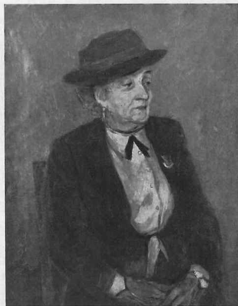
Портрет старого врача. 1957 г.