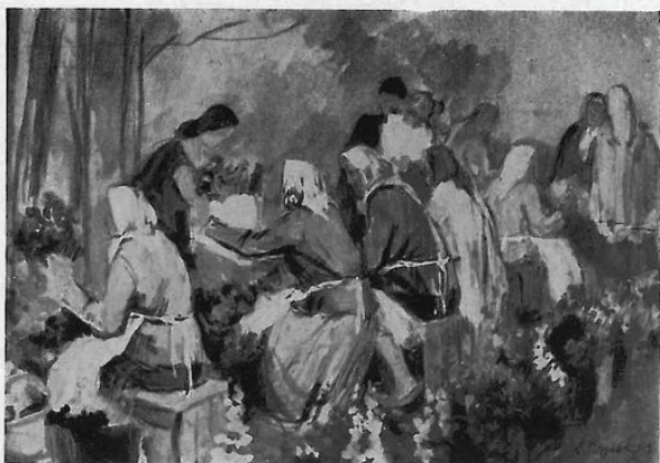
Цветочницы. Одесса. 1958 г.